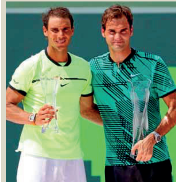
Rafa Nadal y Roger Federer, tras la final de Miami.

S iempre que compites tienes un rival. Equivocadamente en muchas competiciones vemos al rival como el enemigo, pero no es así. E incluso los antideportivos tratan de “jugar al otro deporte” para hacer caer al rival: mentir u obviar injusticias que posibilita sacar una ventaja nada deportiva. Pero tu oponente es justo la persona o el equipo que permite que tú te superes o le ganes. No podrías conquistar una victoria si no fuera gracias a él. Por eso, el rival, es alguien a quien debes tratar con el máximo respeto. Puede ser tu amigo, tu compañero de selección, alguien a quien quieras de forma sincera. Y es que el deporte profesional lleva a convivir en circuitos y campeonatos, a estar lejos de casa y tener como familia a tu propio rival.