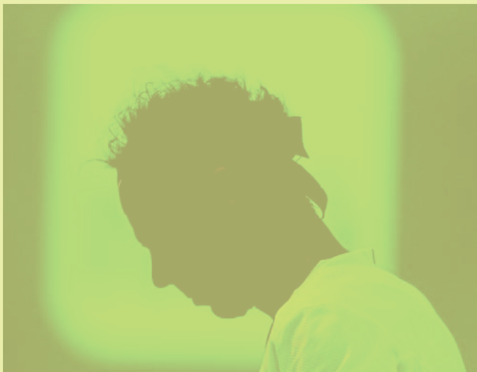
Perfil de Rafael Nadal durante el torneo de Miami.