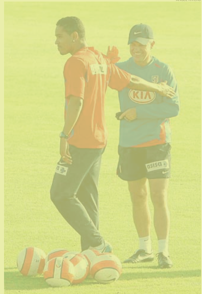
Javier Aguirre (57), junto a Cléber Santana en 2007.