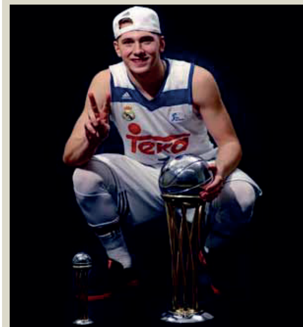
Luka Doncic posa con el título de la Copa del Rey.

Gestionar el éxito no es nada fácil para un adulto o para un jugador que lleva toda la vida persiguiendo títulos. Pero gestionar el éxito a esta edad todavía es más complicado. Requiere de muchas renunciaciones y sacrificio. Requiere compaginar estudios, deporte, emociones y responsabilidad. Y además, forjar una personalidad y educarse en unos valores que permitan al chaval mantener la humildad, el sentido común y el autocontrol impropios en la adolescencia.