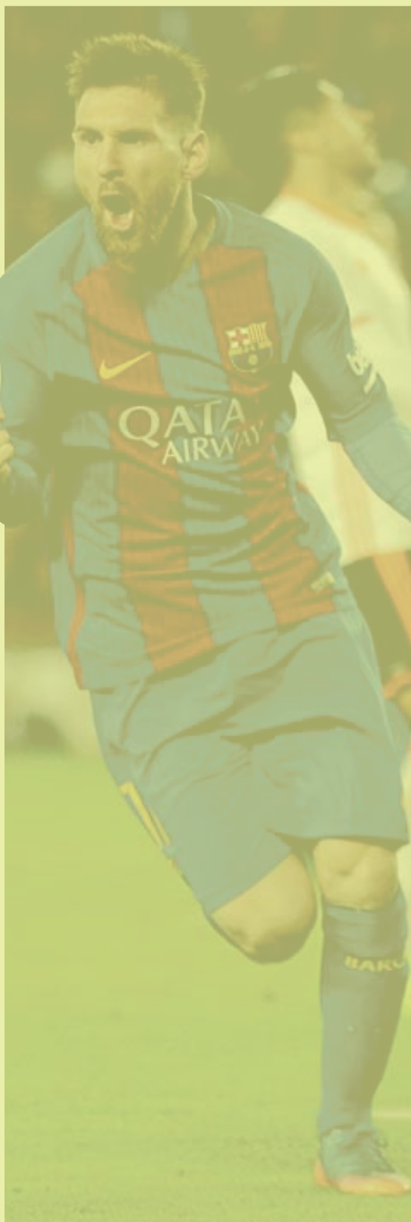
Messi celebra un gol al Valencia (29).

Frente al Deportivo estuvo desaparecido y fue una de las claves por las que el equipo perdió los tres puntos. Una derrota dolorosa porque el Bar-