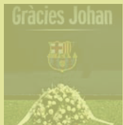
El homenaje. ALEX CAPARROS

La Directiva aprobó ayer por la tarde las acciones que se tomarán con motivo del primer aniversario de la muerte de Johan Cruyff. Las medidas se harán públicas el jueves en un acto en la sede del club. ●