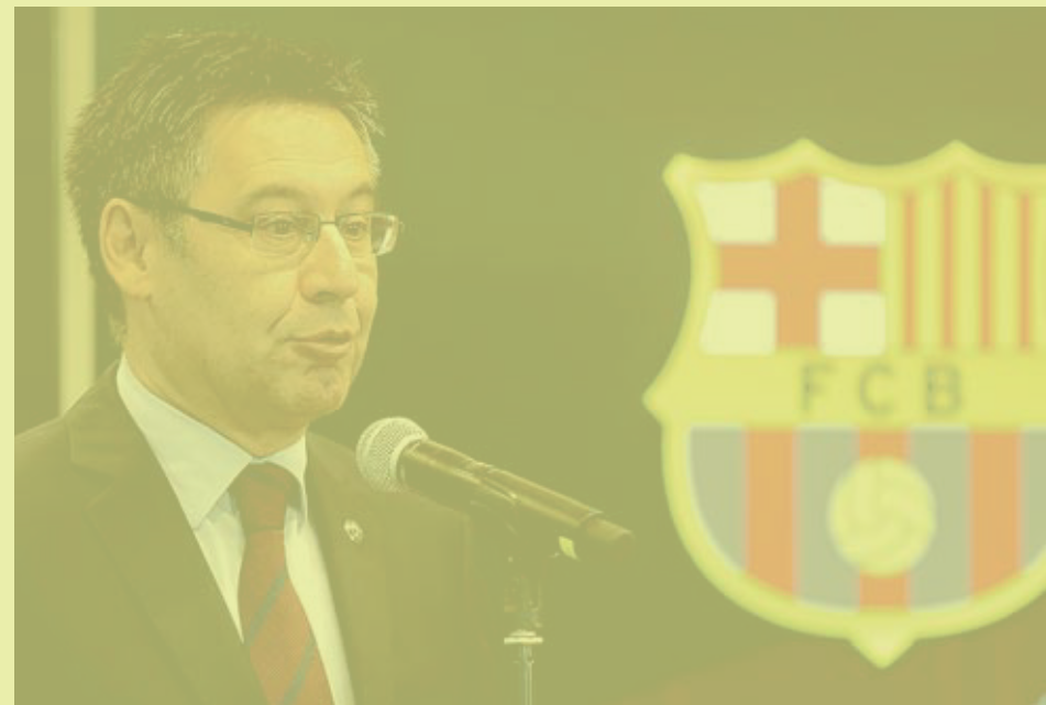
Josep Maria Bartomeu (54), durante una comparecencia.

Somos responsables del legado de sociedad que dejamos a los que vienen detrás. Si queremos cambiar la violencia en el deporte hay que tratar de hacerlo en todas las áreas.